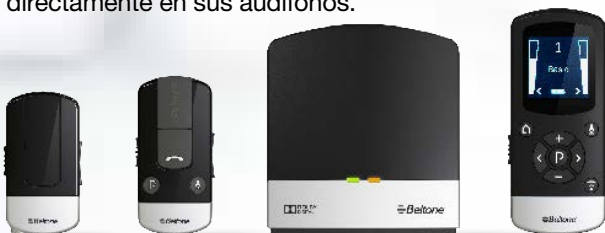
Beltone Direct MyPal

Sólo hace falta enganchar Beltone myPAL a la persona que desea oír y disfrute de cada palabra que diga, directamente en sus audífonos.